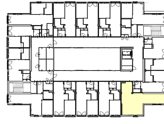
Eerste verdieping positie appartement Schaal 1:500