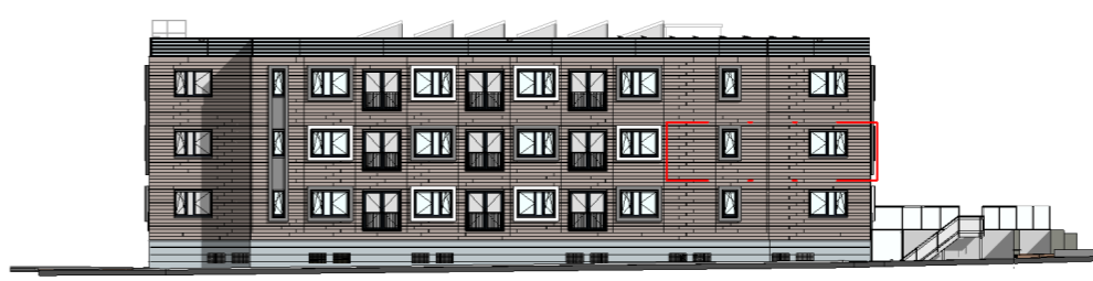
Gevel Kastelenlaan positie appartement schaal 1:500