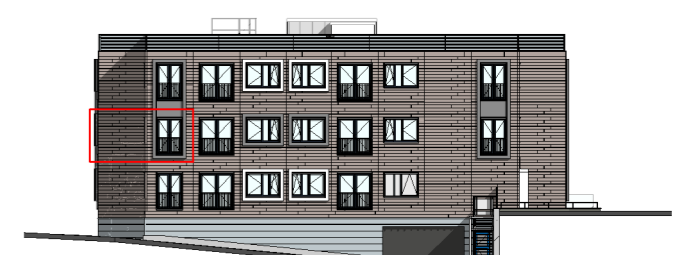
Gevel Proostdijpark positie appartement schaal 1:500