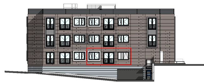
Gevel Proostdijpark positie appartement schaal 1:500