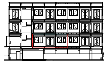
Doorsnede positie appartement Schaal 1:500