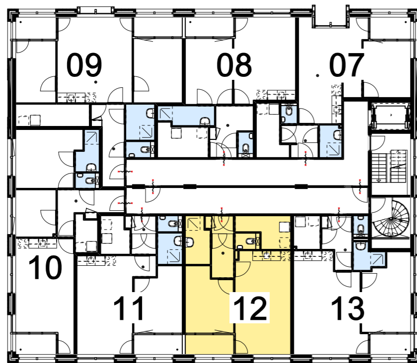
PLATTEGROND 1E VERDIEPING